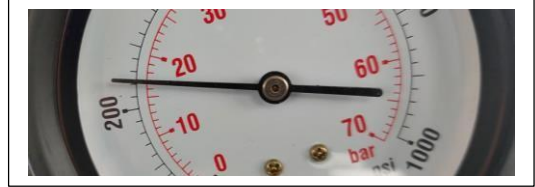
Cilindro # 4 valor de compresión 240 psi, 16 bar