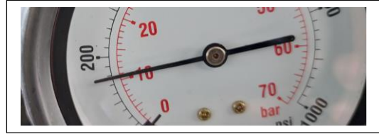
Cilindro # 2 valor de compresión 160 psi, 11 bar