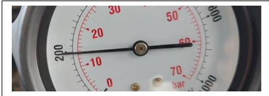
Cilindro # 3 valor de compresión 200 psi, 14 bar