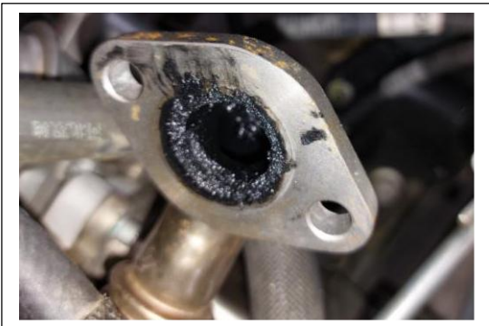
Ducto de la válvula EGR al cuerpo de aceleración con hollín y aceite