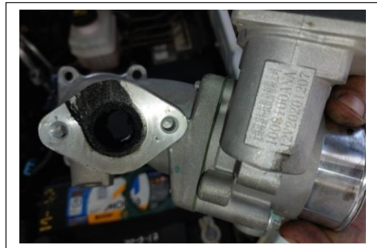
Entrada del ducto de la válvula EGR al cuerpo de aceleración