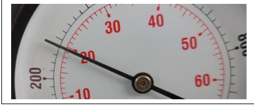
Cilindro # 1 valor de compresión 280 psi, 19 bar