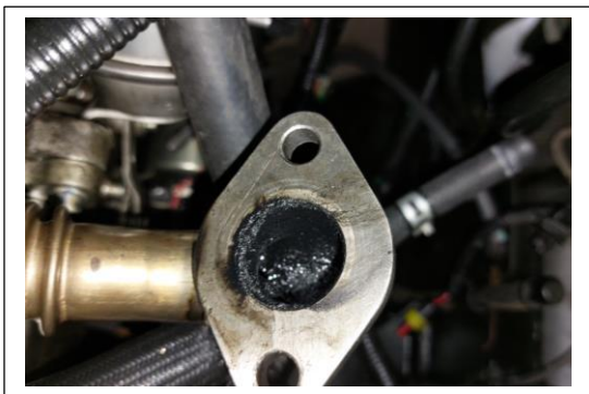
Ducto de la válvula EGR al cuerpo de aceleración con hollín y aceite