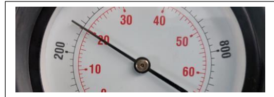
Cilindro # 2 valor de compresión 280 psi, 19 bar