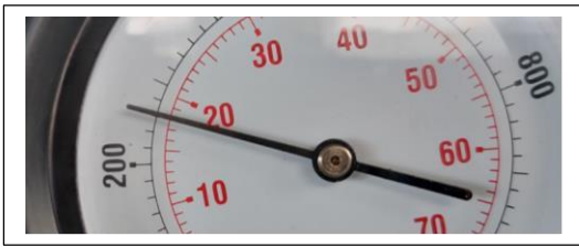
Cilindro # 1 valor de compresión 260 psi, 18 bar