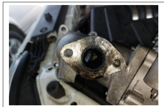
Entrada del ducto de la válvula EGR al cuerpo de aceleración