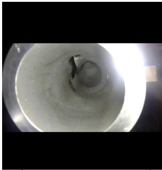
BOTE DE ACEITE POR EL TURBO