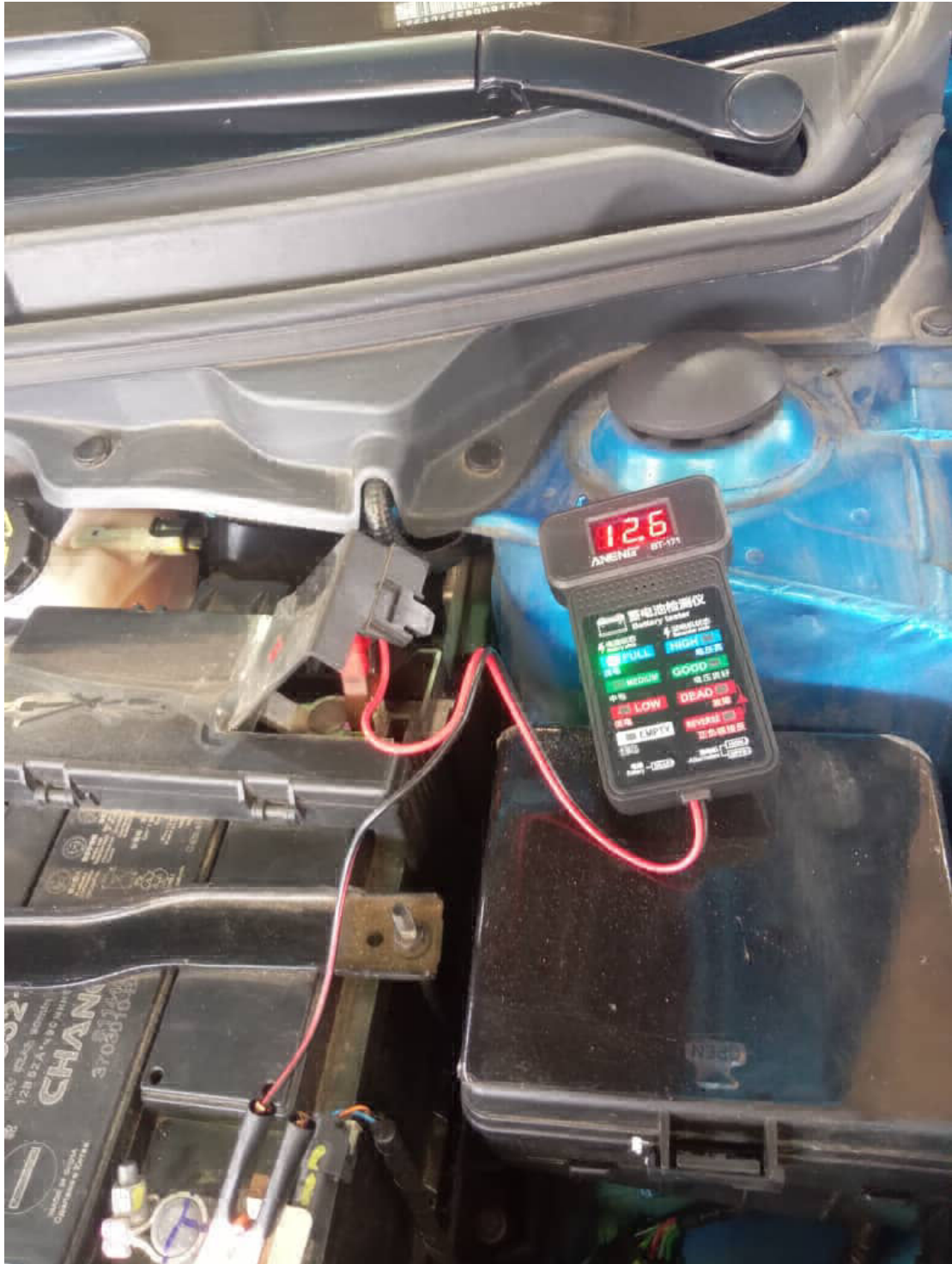
Prueba 1. Bateria Cargada