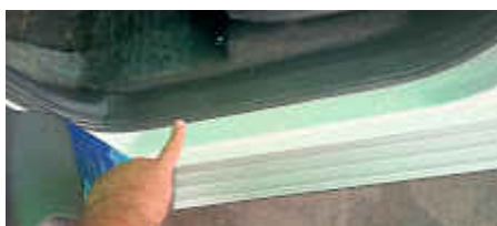
WhatsApp Image 2024-08-08 at 12.16.10 PM.jpeg 208K