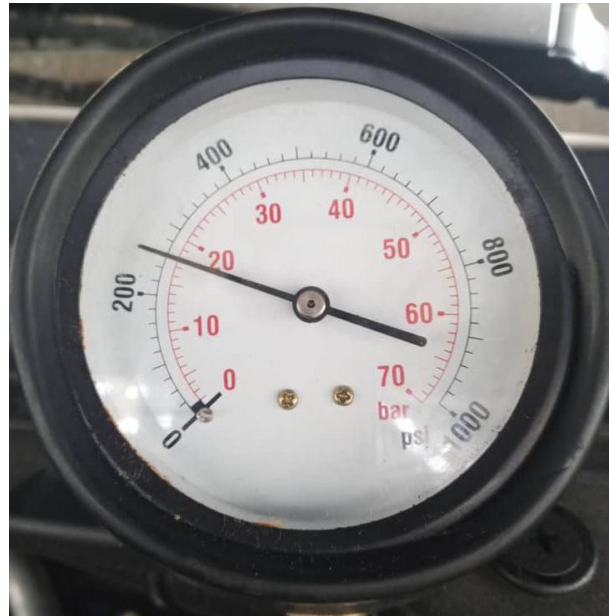
CILINDRO #2: 18 BARES; 260 PSI