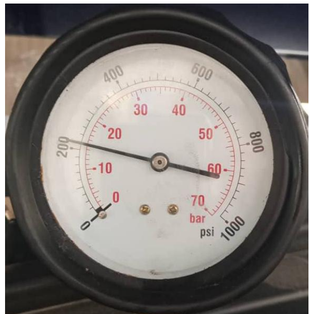
CILINDRO #4: 15 BARES; 220 PSI