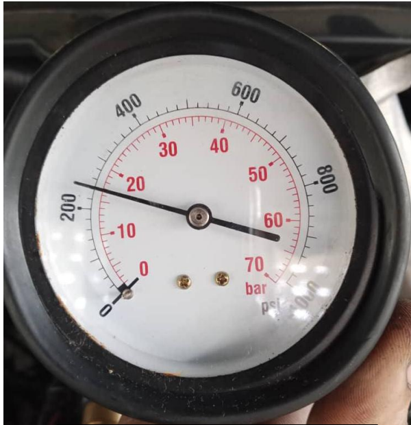
CILINDRO #1: 17 BARES; 240 PSI