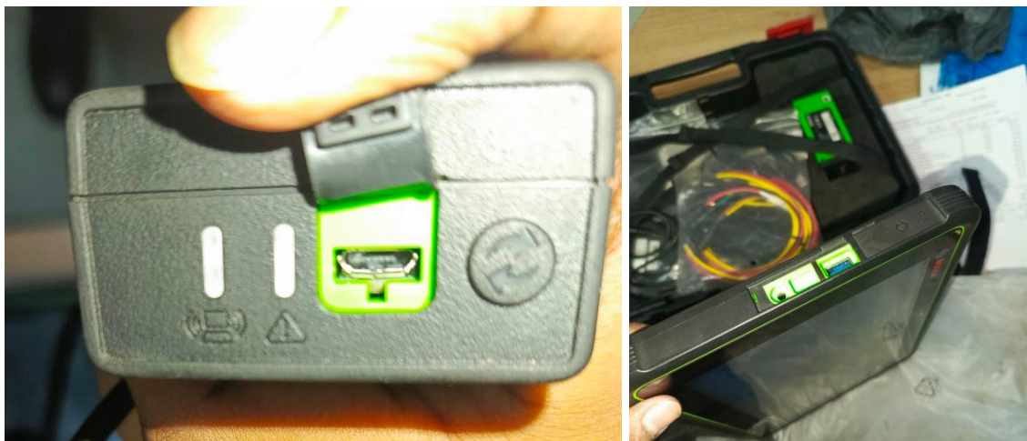
Equipo que se encontraba en uso devuelto para Yaritagua. Equipo con condiciones a Nivel de Puerto USB y sin tapa plástica a nivel de tablet