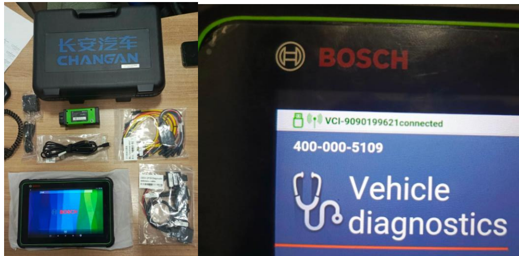
Equipo nuevo entregado y dejado operativo en el concesionario